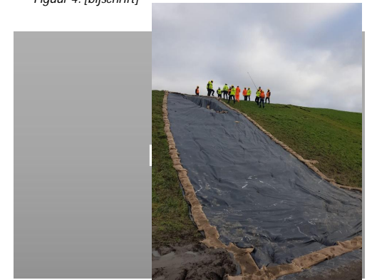
Figuur 7: eindresultaat en evaluatie