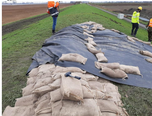
Figuur 6: laatste puntjes op de i