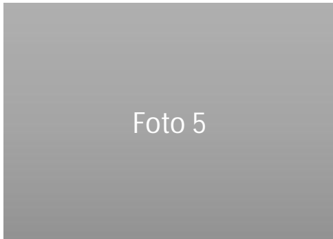
Figuur 5: [bijschrift]