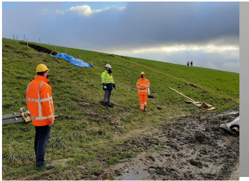
Figuur 2: eerste instructie aan het team