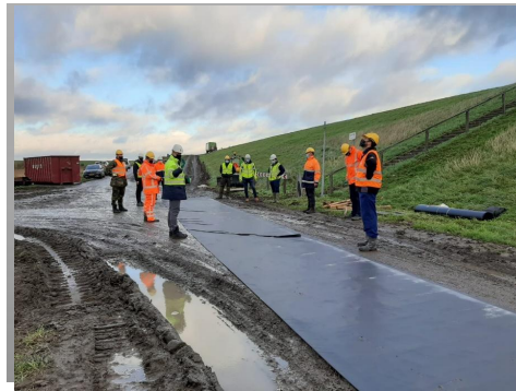
Figuur 3: Instructie voor het verplaatsen van het zeil.